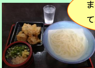
まるちゃん てんぷらが自慢