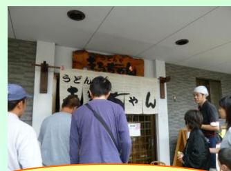
開店前から人だかり

10月7日(土)、香川県東かがわ市の「うどんや まるちゃん」と、香川県さぬき市の「手織りうどん 滝音」に行ってきました。どちらのお店も行列ができており、「さすが！讃岐うどん！」という美味しさでした☆☆☆ 大満足～♪♪ また、行きたいな～♪♪